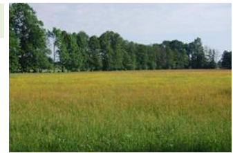
Naturschutzgebiet Grasmeerwiesen, Kreis Gütersloh