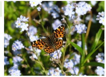
Landkärtchen R. Sossinka