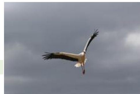
Weißstorch A. Baumgartner