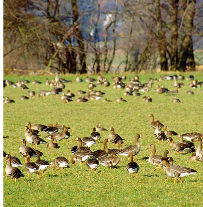
Brauchen Blessgänse wirklich nur 200 m Abstand zu WEA?.

Zudem erarbeitete das Landesbüro für die NRW-Naturschutzverbände eine kurze Stellungnahme zum Gesetzentwurf der Landesregierung zur Umsetzung der Förderung der Gemeinsamen Agrarpolitik in Nordrhein-Westfalen und zur Änderung des Landesnaturschutzgesetzes (LNatSchG), wobei es sich auf die wenigen Änderungen des LNatSchG beschränkte. Insbesondere wurde in der Stellungnahme die Entfristung der Geltungsdauer von Schutzgebietsverordnungen begrüßt, die bisher durch das Ordnungsbehördengesetz NRW auf höchstens 20 Jahre begrenzt war.