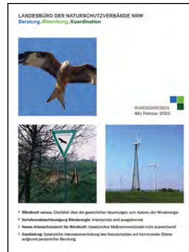
Titelseite Rundschreiben 48.

So informierte es im Januar zunächst über die Stellungnahme der Naturschutzverbände zum Scoping zur geplanten Änderung des Landesentwicklungsplans NRW (LEP) zum Ausbau der Erneuerbaren Energien. Im Februar folgte der jährliche Hinweis zum Thema Baumschnitt und Artenschutz. Im April 2023 folgten Hinweise für die Verbandsbeteiligung zum Thema naturverträgliche Ausgestaltung des Freiflächen-Photovoltaik-Ausbaus, sowie Informationen über die Stellungnahme der Naturschutzverbände zur 3. Offenlage des Regionalplans Ruhr. Die