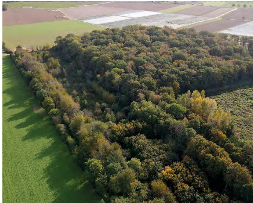
Soll nach Auffassung der Naturschutzverbände als Biotopverbundsfläche erhalten bleiben: Das Manheimer-Sportplatz-Wäldchen.

Neben der raumordnerischen Regelung der Braunkohle-Rekultivierung bedarf es für die Planung der Restseen für Inden und Hambach einschließlich der Befüllung und der Seen-Gestaltung wasserrechtlicher Planfeststellungsverfahren. Zum Sco-