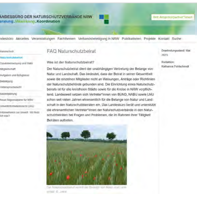
Screenshot: „FAQ Naturschutzbeirat“, Website des Landesbüros der Naturschutzverbände.

Zuletzt hat das Landesbüro im Oktober 2023 die Unterseite „Projekte“ auf seiner Website grundlegend überarbeitet und ausgebaut. Auf der Website können nunmehr sämtliche Projekte nebst Projektbeschreibung, an denen das Landesbüro seit 2009 beteiligt war, wie beispielsweise die Weiterbildung für Naturschutzrecht abgerufen werden.