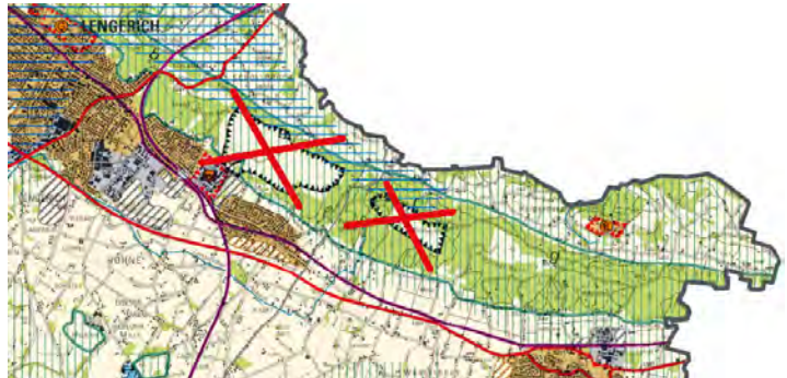
In der Stellungnahme zu den zeichnerischen Darstellungen fordern die Naturschutzverbände die Streichung der Abgrabungsbereiche Lengerich-Hohne und Liene-Höste.

Im August/September 2023 ging der Entwurf für die Neuaufstellung eines Regionalplans für den Regierungsbezirk Detmold in einer überarbeiteten 2. Fassung in die Öffentlichkeitsbeteiligung. Das Landesbüro verfasste zu den geänderten Planunterlagen unter Einbindung von circa sechzig in dem Verfahren engagierten Naturschützer*innen zu den geänderten Planunterlagen eine gemeinsame Stellungnahme für BUND, LNU und NABU.