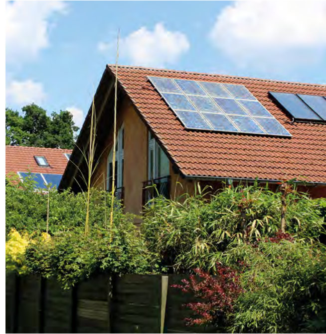
Nach Auffassung der Naturschutzverbände sollten Solaranlagen vorrangig an Gebäuden errichtet werden.

Die 3. Änderung des LEP NRW zur nachhaltigeren Flächenentwicklung startete 2023 mit der Beteiligung zu den Eckpunkten (Unterrichtung der Öffentlichkeit, August 2023) und zur Festlegung des Untersuchungsrahmens für die strategische Umweltprüfung (Scoping, November 2023). Das Landesbüro koordinierte in beiden Fällen eine Stellungnahme in Zusammenarbeit mit den Landesverbänden. Die Naturschutzverbände kritisierten insbesondere, dass der zentrale Aspekt des Biodiversitätsschutzes sowie die Umsetzung aktueller Ziele auf europäischer Ebene nicht Gegenstand dieser Änderung seien. Sie forderten außerdem bezogen auf die bundes- und landesweiten Ziele wirksame Vorgaben zur Reduzierung des Flächenverbrauchs, die sich nicht in einem 5-ha-Grundsatz erschöpfen könnten und denen insbesondere die Verstetigung der sogenannten „Flex-Modelle“ zur Flexibilisierung der Siedlungsentwicklung zuwiderlaufe.