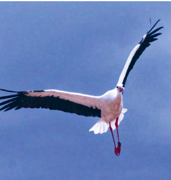
Zentrale Frage bei Genehmigungsverfahren für Windenergieanlagen: Wieviel Artenschutz geht noch? (Weißstorch).

Mit 122 Beteiligungen an immissionsschutzrechtlichen Genehmigungsverfahren für Windenergieanlagen nahm die Fallzahl im Jahr 2023 in Folge des forcierten Ausbaus der Windenergie gegenüber den Vorjahren deutlich zu. Über die rechtlichen Änderungen, unter anderem des Artenschutzrechts im Bundesnaturschutzgesetz (BNatSchG) sowie der Regelungen im Windenergieflächenbedarfsgesetz (WindBG) für Projekte in sogenannten „Go-to-Gebieten“, informierte das Landesbüro im Rundschreiben 48 einschließlich eines Updates (s. S. 11).