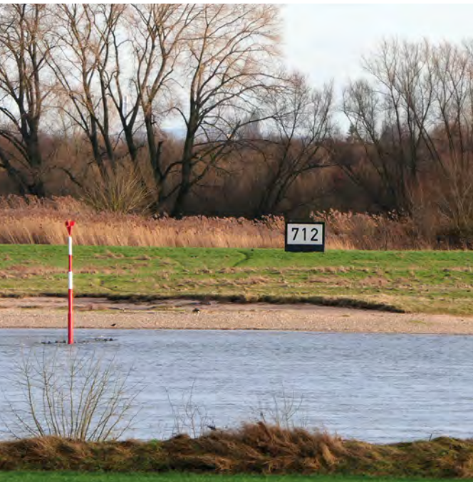
Geplante Entnahmestelle für die Rheinwassertransportleitung bei Dormagen (Bild: N. Grimbach).

ping für die dazu nötige UVP koordinierte das Landesbüro in 4 vorbereitenden Videokonferenzen die Positionierung der Naturschutzverbände und nahm zusammen mit den Vertreter*innen der Verbände an den beiden Scopingterminen teil.