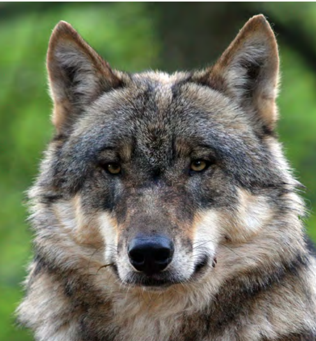
Position der Naturschutzverbände im Kontext Wolf: Herdenschutzmaßnahmen vor Abschuss! (Bild: T. Pusch).