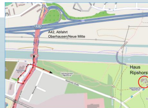
Karte: OpenStreetMap - Veröffentlicht unter CC-BY-SA 2.0 www.openstreetmap.de

Abfahrt A42 Anschlussstelle Oberhausen / Neue Mitte, Fahrtrichtung Oberhausen Neue Mitte, nach ca. 300m hinter der Brücke und der Ampel rechts Richtung OB-Borbeck bzw. Gehölzgarten abbiegen. Direktes Linksabbiegen in die Ripshorster Str. ist nicht möglich! Der Ripshorster Str. folgen Sie ca. 600 m und biegen dann links zum Haus Ripshorst ab.